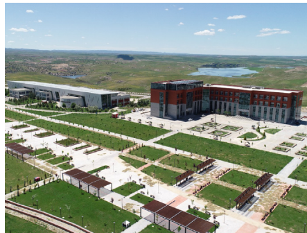
Üniversitemiz Turizm Rehberliği Bölümü Ve Açılış Ön Lisans Programı Turak Tarafından Akreditasyon Almaya Hak Kazandı