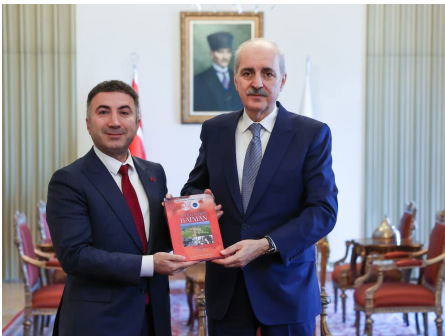
Rektör Demir'den Türkiye Büyük Millet Meclisi Başkanı Numan Kurtulmuş'a Ziyaret