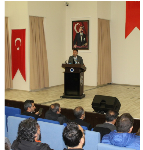
Basın ve Halkla İlişkiler Koordinatörlüğü