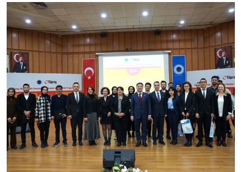
Üniversitemiz Ve Tüpraş İş Birliğiyle Yürütülen 'Genç Beyinlerde Inovasyon Ve Kadın Girişimcilik Programı' İlk Mezunlarını Verdi