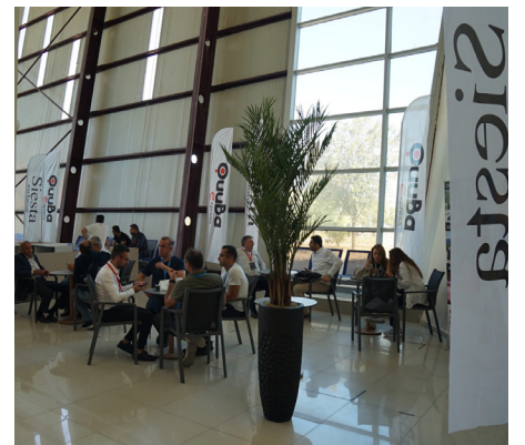
Basın ve Halkla İlişkiler Koordinatörlüğü