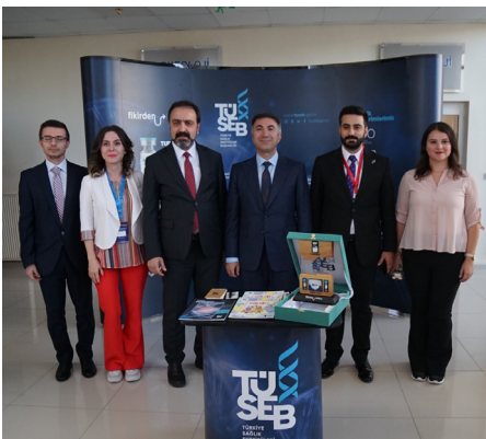
26 Bilgiye Enerjiye Dönüştüren Üniversite

ları Batman'da buluşturdukları için mutlu olduklarını söyledi. İkincisinin gerçekleştirildiği Uluslararası Bilişim Kongresi kapsamında ilimizi yurt dışına açma ve tanıtma imkânı bulduklarını anlatan Rektör Demir sözlerine şu şekilde devam etti: "Bu kongre ile birlikte önemli bir çalışmaya imza attık. Akademisyen, öğrenci ve firmaları aynı çatı altında toplayarak tecrübe paylaşımında bulunduk. Alanında uzman isimlerin verdiği seminerlerle çok kıymetli bilgiler edindik. Üniversitemiz ve şehrimiz için böylesine önemli bir çalışmaya ev sahipliği yapmaktan gurur duyuyoruz. Emeği geçen herkese teşekkürlerimi sunuyorum."