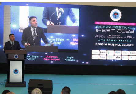
Basın ve Halkla İlişkiler Koordinatörlüğü

Bilişim alanında dünyada önemli gelişmeler ve değişimler yaşandığının altını çizen Rektör Demir açıklamalarına şu şekilde devam etti: "Festivale katılan konuşmacılardan ve firmalardan alınacak bilgiler, üniversitemiz öğrencilerinin bilişim konusundaki bilgi dağarcıklarını önemli ölçüde artırdığını düşünüyorum. Batman Üniversitesi kısa sürede tüm bileşenleriyle birçok alanda önemli kazanımlar elde etti ve kapasitesini her geçen gün artırdı. Bu tür nitelikli organizasyonların üniversitemizin ev sahipliğinde yoğun katılımı gerçekleştirilebilmesi bizi daha da motive ediyor. Bu festival gösterdi ki Batman Üniversitesi olarak daha büyük organizasyonlar gerçekleştirebilecek enerji ve potansiyele sahibiz. Festivalin düzenlenmesinde katkı sunan herkese teşekkür ediyorum."