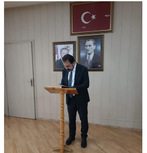
Basın ve Halkla İlişkiler Koordinatörlüğü