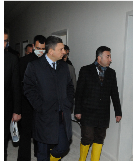
Basın ve Halkla İlişkiler Koordinatörlüğü

Adres: Batman Üniversitesi Rektörlüğü, 72100, Kampüs / BATMAN Telefon: 444 9 072 İnternet: www.batman.edu.tr E-Posta: basin.yayin@batman.edu.tr Üniversitesi Rektörlüğü, 72100, Kampüs / BATMAN Telefon: 444 9 072 Basım Türü: Aylık Kültürel Gazete