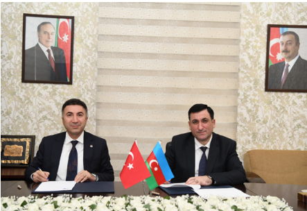
Üniversitemiz ile Azerbaycan Devlet Petrol ve Sanayi Üniversitesi Arasında İş Birliği Protokolü İmzalandı Sayfa 18