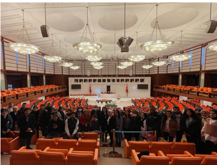
Basın ve Halkla İlişkiler Koordinatörlüğü