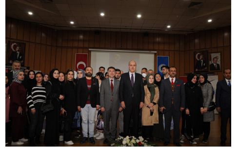
Prof. Dr. Numan Kurtulmuş Üniversitemizi Ziyaret Etti