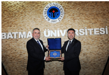
Cumhurbaşkanı Başkanışmanı Ahmet Minder Üniversitemizi Ziyaret Etti Sayfa 15