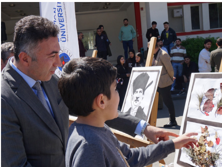
Üniversitemizde 2 Nisan Dünya Otizm Farkındalık Günü Etkinliği Yapıldı