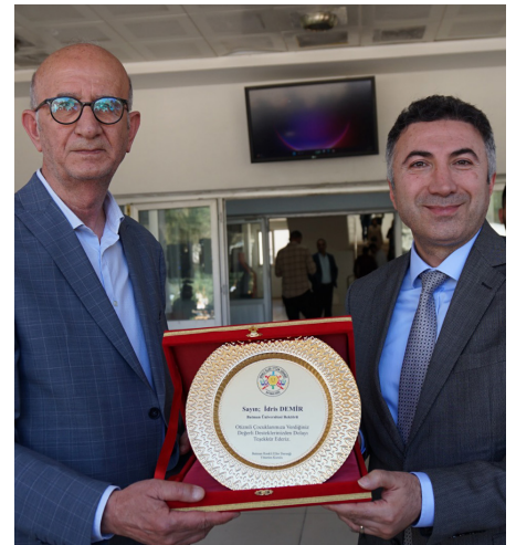
Basın ve Halkla İlişkiler Koordinatörlüğü