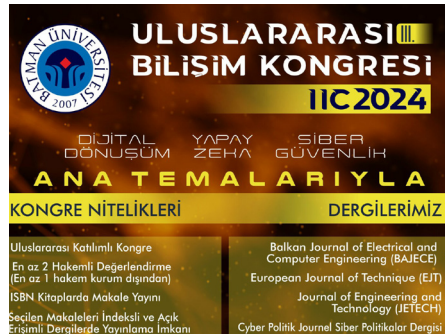
III. Uluslararası Bilişim Kongresi Başlıyor