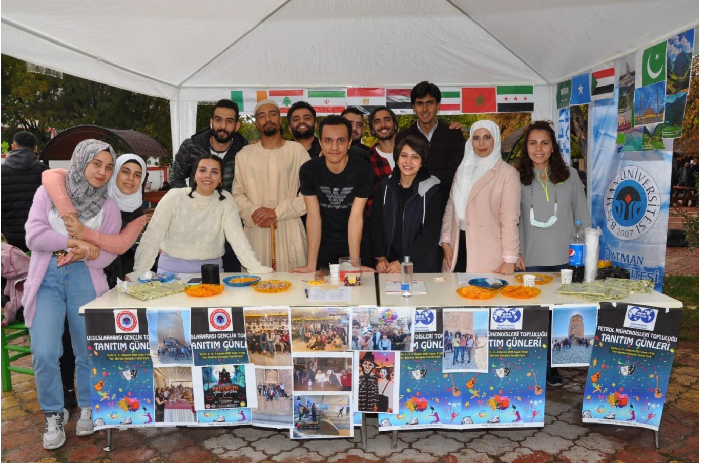
Batman Üniversitesi ile Genç – Ofis iş birliğiyle öğrenci ve personele yönelik pilav etkinliği